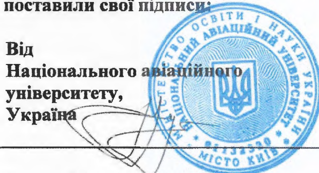
Доктор Максим Луцький Ректор Національного авіаційного університету

Від Національного авіаційного університету, Україна